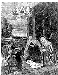
«Adorazione dei pastori» olio su tela di Tiziano