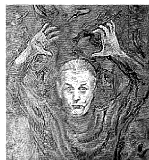
Autoritratto di Dario Fo in mostra a Palazzo Reale