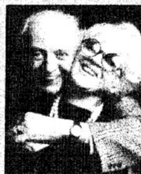
Dario Fo e Franca Rame

Il comitato "Il Nobel per i disabili" fondato da Dario Fo e Franca Rame non si concede tregua. Ieri sera i due artisti si sono esibiti all'Auditorium in una serata organizzata dalla Volkswagen che da tempo è vicina al mondo dei portatori di handicap. La sala era esaurita, l'incasso è stato interamente devoluto alla Onlus fondata da Dario Fo e Franca Rame nel 1997 dopo la conquista del Nobel. Da allora la collaborazione di Fo e la Rame con la casa tedesca è sempre stata molto stretta tanto che sono oltre 40 i pulmini Volkswagen dal valore di circa 30 mila euro donati dal comitato alle varie strutture che si occupano di disabili. Il più grande costruttore europeo vuole fare di più. Ha organizzato una scuola guida e corsi di guida sicura dedicati; ora, insieme alla Europcar, noleggerà vetture appositamente attrezzate nei principali aeroporti italiani.