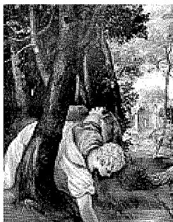
«Narciso» di Tintoretto in mostra a Palazzo Reale