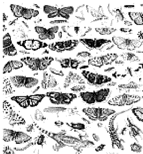
«Studi di farfalle e altri insetti» di Jan Van Kessel il Vecchio