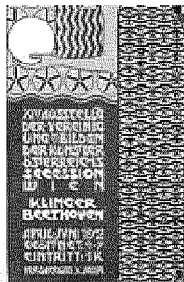
Manifesto di Alfred Roller della Secessione viennese

Settanta dipinti e trenta disegni e grafiche ripercorrono la storia e l'eccezionale talento della più importante famiglia di artisti fiamminghi tra il XVI e il XVII secolo. Villa Olmo di Como (via Cantoni 1). Tel. 031.574240. Orario: da martedì a giovedì 9-20; da venerdì a domenica 9-22; lunedì chiuso. Fino al 29 luglio.